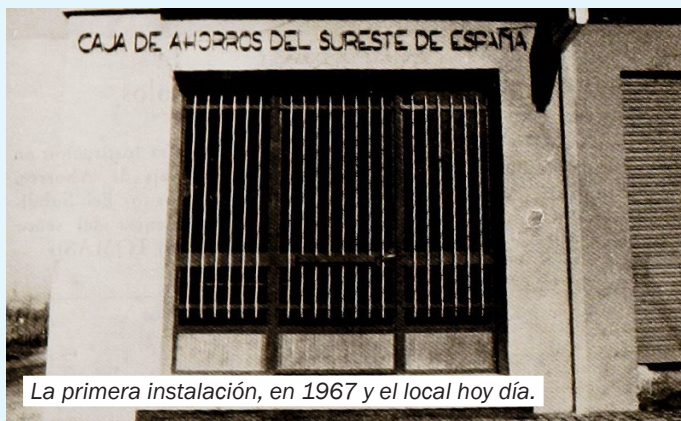
La primera instalación, en 1967 y el local hoy día.