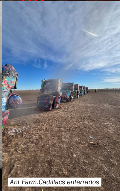
Ant Farm. Cadillacs enterrados