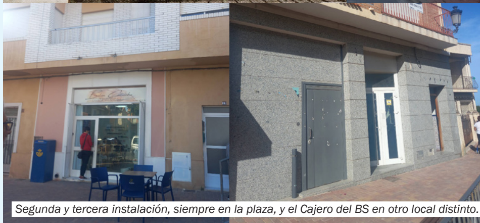
Segunda y tercera instalación, siempre en la plaza, y el Cajero del BS en otro local distinto.