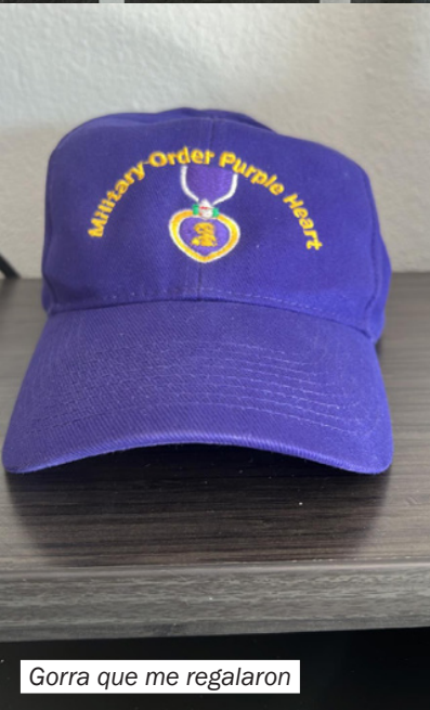
Gorra que me regalaron